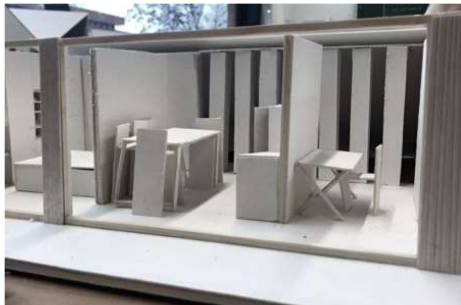
POSTUP PRVOTNÝCH NÁVRHOV DOMU DO 40m 2